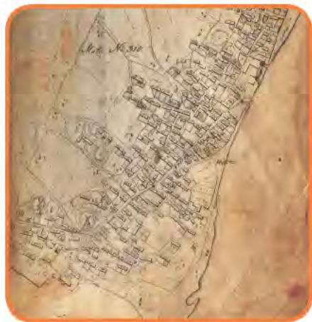
Landinspektør G. Thobølls kort fra 1820. Det første kort over byen.

Nordby blev oprindeligt kaldt Odden, og det første sikre vidnesbyrd om beboelse stammer fra 1200-tallet. Som fiskerleje i 1500-tallet lå den første bebyggelse orienteret øst-vest med slipper mod kysten. Overgangen fra fiskerleje til søfartsby blev mulig, da øen købte sin selvstændighed af kronen i 1741 og fik retten til søfart. Nordby blev hjemsted for en stor skibsflåde og oplevede en storhedstid som søfartsby i anden halvdel af 1800-tallet. Byfornyelse og vækst gav byen købstadspræg. Især i 1890'erne var der stor byggeaktivitet: Anlæggelsen af havn og jernbane ved den nye by Esbjerg og turismens indtog gav nye indtægtsmuligheder. Efter 1900 stagnerede udviklingen – sejlskibsfarten blev overtaget af Esbjerg, men samtidig gav nærheden til Esbjerg Nordbys beboere nye erhvervs muligheder.