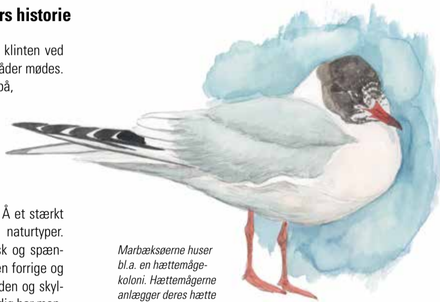
Marbæksøerne huser bl.a. en hættemågekoloni. Hættemågerne anlagger deres hætte i løbet af februar/marts.

Siden istidens afslutning har havet ædt sig ind på kysten og nedbryder stadig klinterne bid for bid. I løbet af de seneste par tusind år har havet dog også aflejret store mængder sand i Vadehavet, som her ved Ho Bugt har sin nordlige grænse. Frem af havet voksede dermed en såkaldt »barrierekyst«, hvor halvøen Skallingen i dag til en vis grad beskytter klinterne mod havets nedbrydende kræfter.