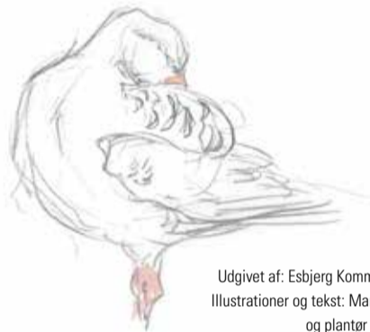
Udgivet af: Esbjerg Kommune, 2016 Illustrationer og tekst: Marco Brodde og plantør Claus Løth Tryk: TopTryk Grafisk

Syd for Sjelborg Plantage ligger Sjelborg Camping. Nordøst for Marbæk Plantage findes to 18 hullers golfbaner.