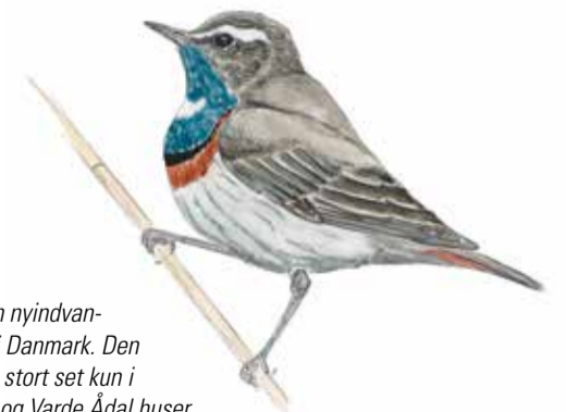
Blåhalsen er en nyindvandet ynglefugl i Danmark. Den yngler indtil nu stort set kun i Sydvestjylland og Varde Ådal huser flere par. Fra midten af marts skal blåhalsen eftersøges i grøfter og enge med rørskov. Den synger mest i de tidlige morgentimer og om natten.

Store dele af de lavtliggende enge ved Marbækgård har været opdyrket indtil 1970, som var det sidste år med korndyrkning. Andre dele har været brugt til græsning, og indtil ca. år 1900 har der også været gravet tørv i engene, hvor Esbjerg Kommune i 70'erne anlagde tre søer, som i dag er et karakteristisk element i Marbæks varierede landskab.