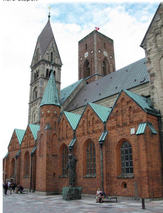
Fortsettes næste side

Set udefra er domkirken bemærkelsesværdigt uensartet, fordi den er blevet opført i flere etaper.