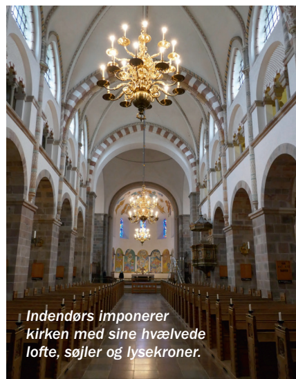
Indendørs imponerer kirken med sine hvælvede lofte, søjler og lysekroner.

Ribe ligger i det sydvestlige Jylland og har omkring 8.300 indbyggere. Byen har på grund af de mange turister en del restauranter, og her skal ikke mindst Porsborgs Gastro Bar anbefales. Trods navnet er det primært en restaurant, der ligger på torvet lige over for domkirken, og her spiser man intet mindre end fremragende, ligesom betjeningen er venlig og belevet. Restauranten ligger i hyggelige kælderlokaler, der stammer tilbage fra 1582. Den nærliggende Restaurant Sælhunden er bestemt også værd at stifte bekendtskab med – blandt andet har de glimrende frokostplatter. Vi boede på Ribe Byferie Resort, der byder på store ferielejligheder, som er beliggende helt inde i bycentrum. Et fint udgangspunkt for en rundtur i Ribe og omegn.