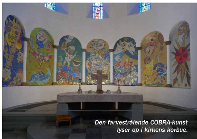
Den farvestrålende COBRA-kunst lyser op i kirkens korbue.